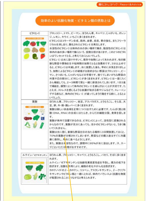
結果を踏まえて推奨される栄養素・生活習慣のアドバイスつき！